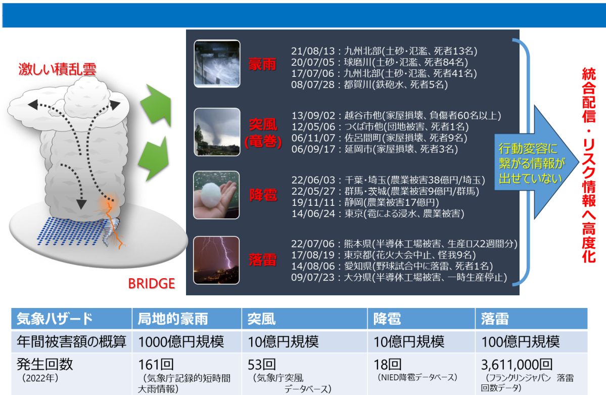
図 1 積乱雲マルチハザードの状況

積乱雲危険度予測情報を研究開発し実装することは、レジリエントな社会の実現に重要であるものの、積乱雲予測をハザードリスク情報として提供し、多様な企業で活用していただくためには、積乱雲予測技術のさらなる高度化と有効性の実証が必要な状況です。